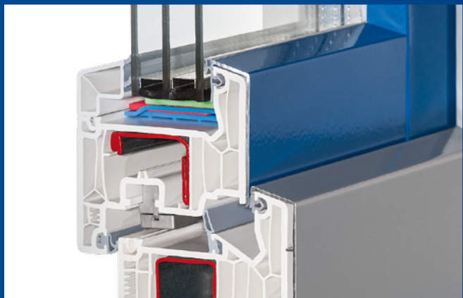
Perfekte Verbindung: Die individuell gestalteten Aluminium-Vorsatzblenden verdecken die Kunststoffprofile von außen vollständig.

Kunststofffenster mit Aluminium-Vorsatzblenden – die wirtschaftliche Lösung für höchste Ansprüche an Design, Ästhetik und Wohnkomfort.