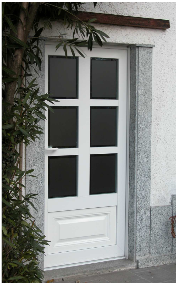
Esempio di porta a vetri con traversi e montanti

Sono naturalmente predisposte, per l' alloggiamento di ferramenta vetri e pannelli anti effrazione secondo le più moderne tecniche a disposizione sul mercato.